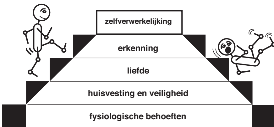
Figuur 1: De behoeftenhiërarchie van Maslow

Het begrip milieubewust bevat de begrippen milieu en bewust zijn. Het begrip milieu kwam reeds aan bod bij de bespreking van het ecosysteem. We vervolgen met een bespreking van het begrip bewustzijn. Bewustzijn is moeilijk eenduidig te maken maar een poging daartoe is onvermijdbaar. ►