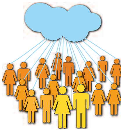
Figuur 4: Collectief bewustzijn

Het collectieve bewustzijn is volgens de Franse socioloog Durkheim het geheel van opvattingen en sentimenten die gemeenschappelijk zijn voor een gemiddelde burger van dezelfde samenleving. Deze definitie van bewustzijn komt dicht in de buurt van wat wij in artikel 'De apotheekloze dierenarts: doem of zegen?' (5) als cultuur omschreven. Cultuur vertegenwoordigt de kennis van de voorvaderen en vormt het groepsgeheugen van een gemeenschap, niet alleen op het gebied van waarden en normen, maar ook op het gebied van taal en techniek, kortom alle kennis die van vitaal belang is om te kunnen overleven. Andere wetenschappers gaan nog verder zoals de Engelse hoogleraar Rupert Sheldrake met zijn morfogenetische resonantie wijst op het verschijnsel, dat als genetische identieke muizen op verschillende tijdstippen en op verschillende locaties een identiek probleem krijgen aangeboden, de latere groep de problemen altijd sneller oplost dan de begingroep. Dit zou wijzen op een