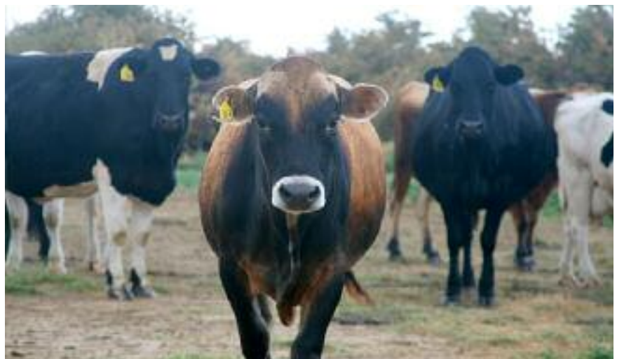
Figuur 5: De optimale koe

De veranderingen naar een duurzame rundveefokkerij is een aansprekend voorbeeld van de overgang van maximalisatie naar optimalisatie. De schaalvergroting in de periode van Mansholt leidde in de veeteelt tot een genetische selectie van koeien op enkelvoudige, eenvoudig meetbare productiekenmerken die direct geld opleverden. Hierbij keek men vooral naar de hoeveelheid geproduceerde melk, de eiwitgehalten en de vetgehalten. Het fokdoel was eenvoudig: koeien fokken die maximaal bijdragen aan de voedselproductie. De naoorlogse emotie van nooit meer honger eindigde zo in een melkplas en een boterberg. De huidige fokdoelen van een organisatie als CRV (7) zijn inmiddels gericht op veel bredere, duurzamere kenmerken als klauwgezondheid, vruchtbaarheid, levensduur en weerstand. Deze kenmerken worden bij het fokbeleid meegewogen als belangrijke aspecten naast de productiekenmerken. Men streeft niet langer naar de maximale fokstier maar naar de optimale fokstier. Hierbij kan de CRV terugvallen op een zeer uitgebreide database met kengetallen en gegevens over de eigenschappen van de vele nakomelingen. Het hoogwaardige kennisniveau leidt zo tot ►