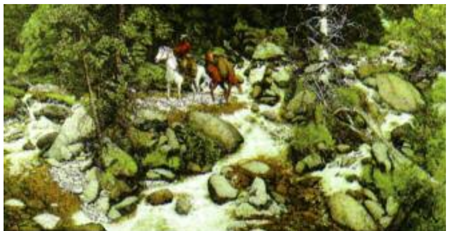
Figuur 3: Verborgene gezichten

Rijst de vraag waar het menselijk bewustzijn zijn zetel heeft. Neurologisch bewustzijnsonderzoek bij mensen beperkt zich momenteel vooral tot de neuronale activiteit in hersengebieden waarvan men aanneemt dat zij als representatie- en geheugenlocatie fungeren voor de verschillende functies van het menselijk bewustzijn. Het is echter evengoed mogelijk het hele lichaam te beschouwen als zetel van het bewustzijn en het geheugen. Wanneer we